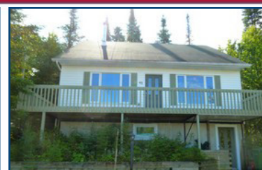
Chalet au Valinouët: 43, rue Val d'Isère, 5 chambres. Thierry