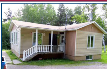
Jonquière: 6460, rue St-Wilbrod. Terrain 475 000 pi.ca. Raymond