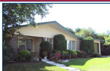
Chicoutimi: 489, rue de Sales. Près de l'hôpital. Raymond